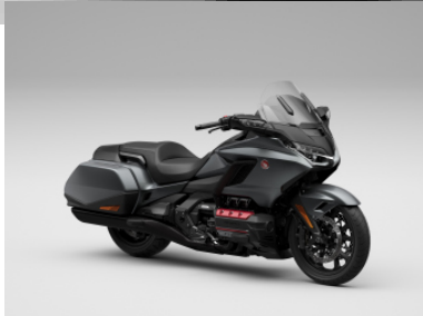
Mat Iridium Gray Metallic - DCT