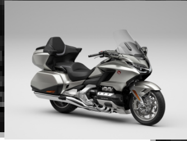
Beta Silver Metallic - DCT