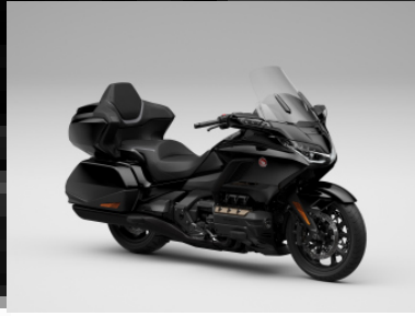
Graphite Black - DCT/MT