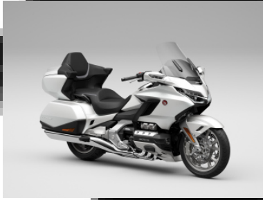
Pearl Glare White - DCT