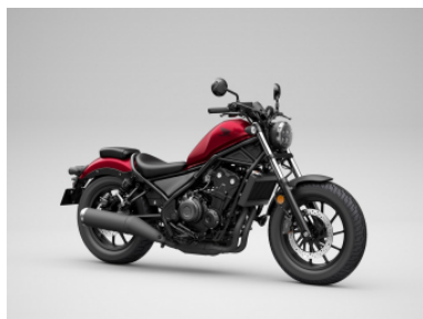
CANDY DIESEL RED