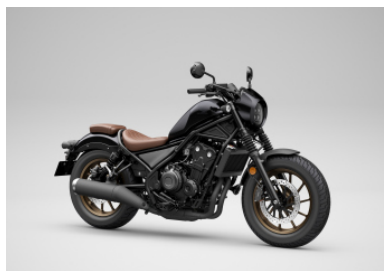
PEARL SHINING BLACK